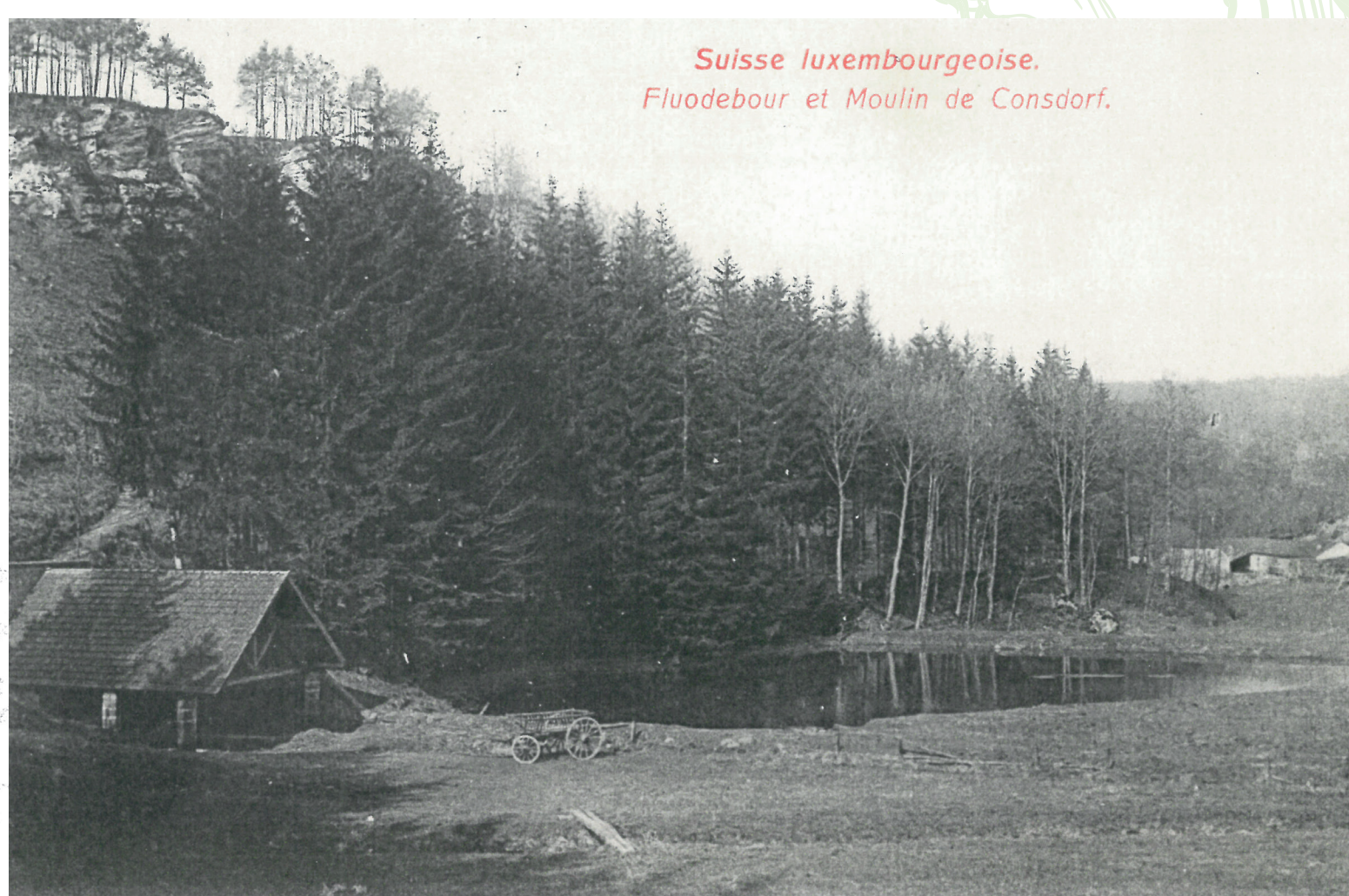
Suisse luxembourgeoise. Fluedebour et Moulin de Consdorf.